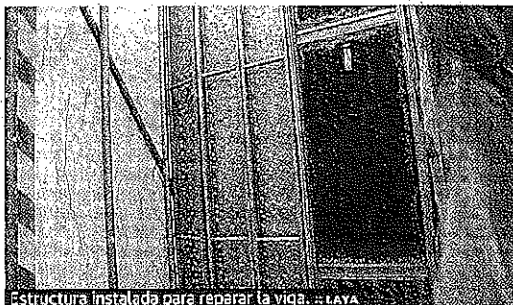
Estructura instalada para reparar la viga.

:: WORD. La reparación de la viga que se desprendió el día 23 de agosto y que ha estado desde entonces, durante las Fiestas y Puestas, apuntalada para evitar mayores destrozos, comenzó hace un par de días con la instalación de un andamio cubierto por una lona que en su interior esconde una estructura para apuntalar la estructura.