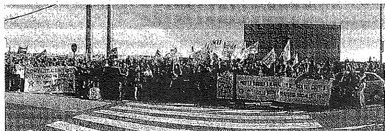
Empleados de la empresa, durante la concentración ante la sede. -- WORD

Los trabajadores de una de las empresas con más empleados de nuestra provincia (no pueden estar sin la protección de un convenio que regule sus relaciones laborales, máximo cuando desde la empresa se están intentando introducir nuevas condiciones en su trabajo, siempre