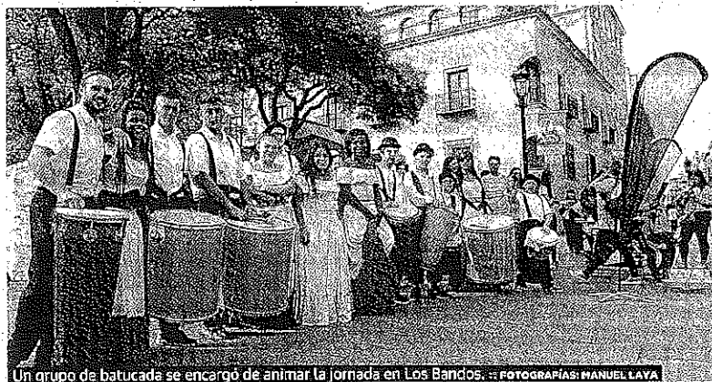
Un grupo de batucada se encargó de animar la jornada en Los Bandos.

:: WORD. Salamanca participa esta semana en dos destacadas ferias de turismo internacional a través del Patronato Provincial de Turismo y bajo el paraguas de la consejería de Cultura y Turismo. Hasta hoy estará presente en la Feria IFTM-Top Resa 2016, que se celebra en París, y hasta el domingo participará en JATA Tourism EXPO JAPAN, la feria nipona más importante.